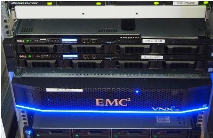
iNTECE – neue virtuelle Umgebung in Regensburg