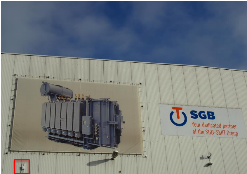
Starkstrom-Gerätebau GmbH in Regensburg